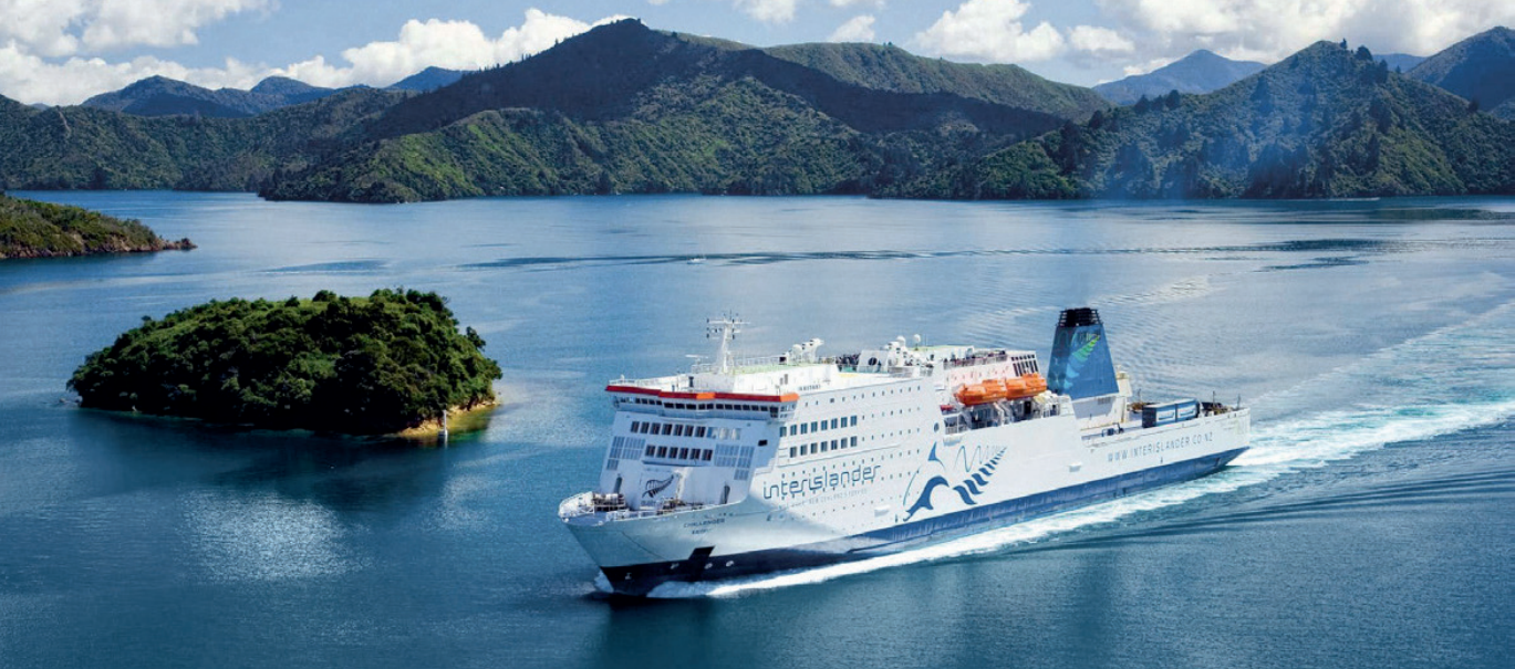
▲ Die 182-Meter Fähre »Kaitaki« ist die größte ihrer Art in neuseeländischen Gewässern. Sie ist ausgestattet mit dem modernsten Alarm-, Überwachungs- und Steuerungssystem von CSI und Bachmann.