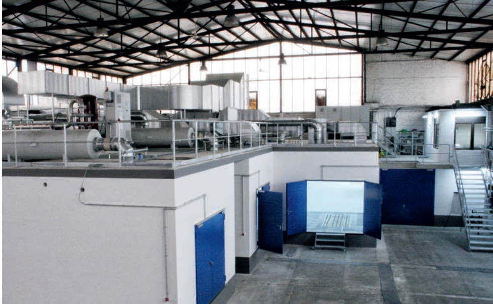
▲ Eindrücklich: Prüffeld der GVH mit drei Prüfständen und den Versorgungseinrichtungen (Lüftung, Kühlung, Abgasabsaugung, Kraftstoffversorgung) auf dem Dach.