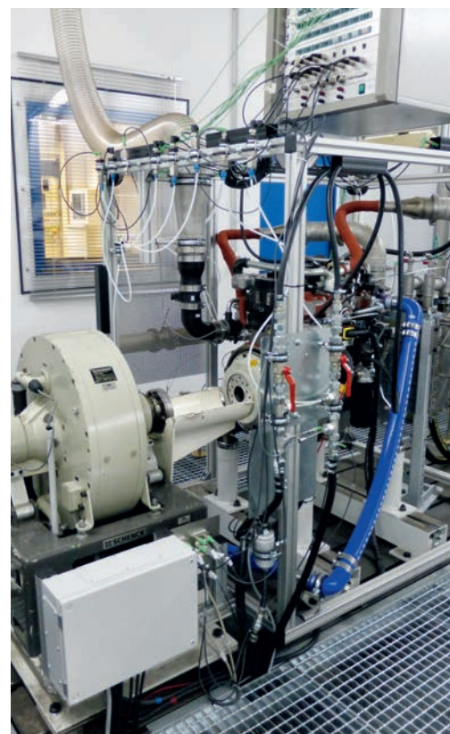
▲ Viel Peripherie: Versorgungs- und Messeinrichtungen nehmen innerhalb der Prüfstände viel Raum ein. Die Automatisierungstechnik ist weitgehend außerhalb der Prüfstände installiert.

Auf einem Verbrennungsmotorenprüfstand wird der Prüfmotor mittels einer Leistungsbremse unter Last betrieben. So können die verschiedenen Anwendungen untersucht und die wesentlichen Betriebszustandsgrößen gemessen werden. Die Betriebsbedingungen sollen dabei bekannt und reproduzierbar sein, um Umgebungseinflüsse auf die Messergebnisse zu minimieren. »Kühlwasser, Kraftstoff und Ansaugluft werden beispielsweise auf eine bestimmte Temperatur und einen bestimmten Druck geregelt, bevor sie dem Prüfmotor zugeführt werden«, erklärt Dr. Musiolik. Damit müssen die Regelkreise einerseits erhebliche Störgrößen ausgleichen, andererseits für unterschiedliche ►►